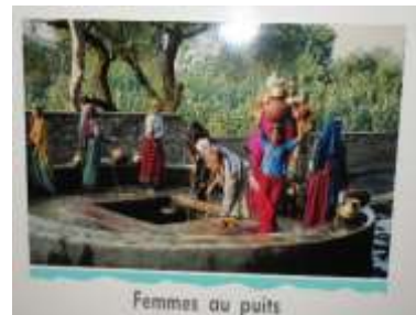
Femmes au puits