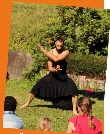
Septembre : journée du patrimoine à la chapelle Notre Dame de Bon Secours. Spectacle de la compagnie MO3