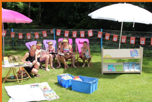
Juillet-août : la médiathèque était présente à la piscine une fois par semaine