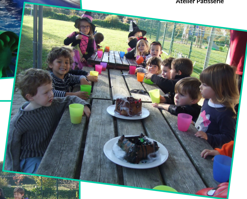
Halloween au centre de loisirs