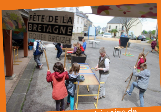
Mai : exposition sur le patrimoine de Bretagne et animation jeux bretons

Avril : exposition et spectacle bande dessinée/concert « visions » par la compagnie « les visions d'Edgar »